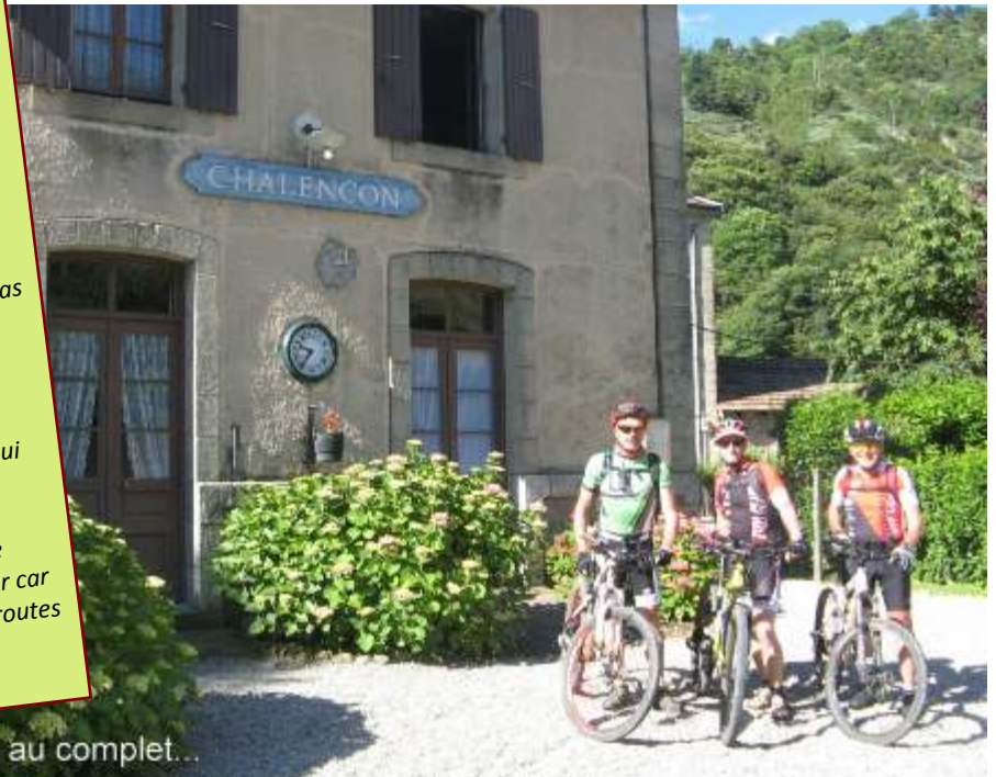
La SNCF au complet...