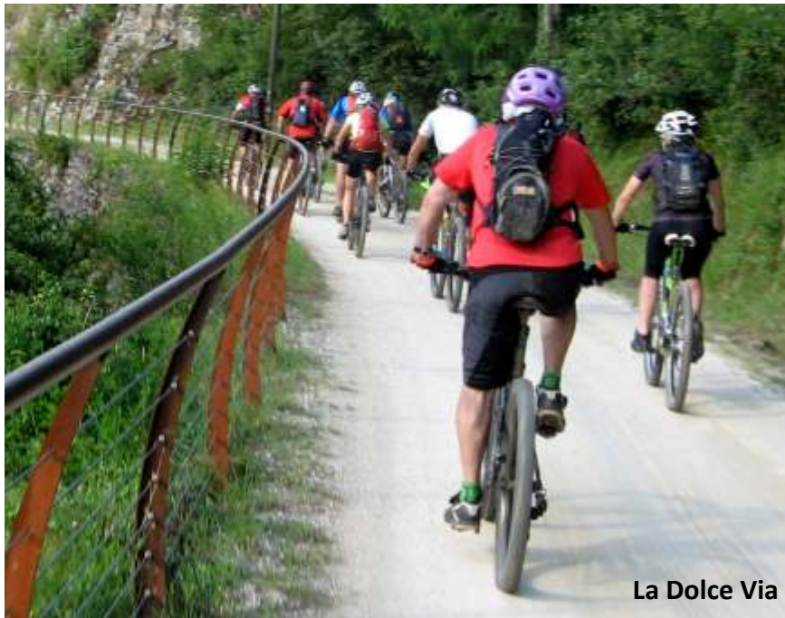
La Dolce Via