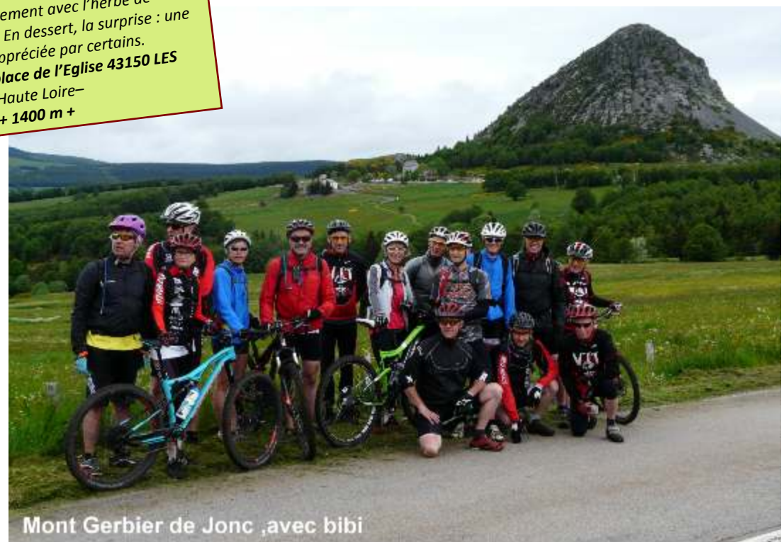
Mont Gerbier de Jonc ,avec bibi