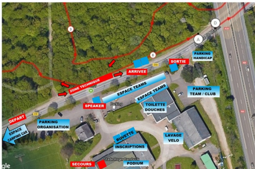
COUPE VTT GRAND EST 2020 plans du site

Reconnaissance ouverte à partir du mercredi 10 au samedi 13 mars après midi