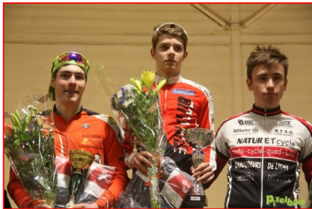
Les points stratégiques de la Course: L'angoisse des départs, l'adrénaline et l'effort de la course, le suspens à l'arrivée, l'émotion et la récompense des podiums !