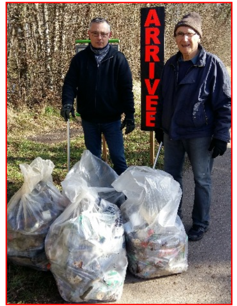
Une démarche écologique, nettoyage du parcours, avant et après la course.