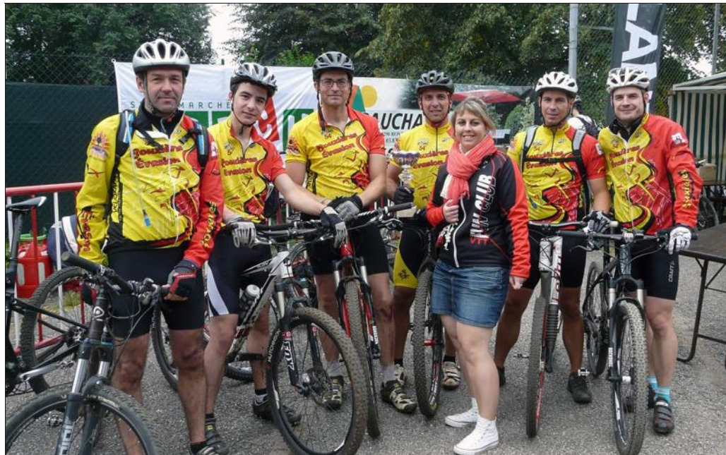
■ La coupe du club le plus représenté a été décernée à Bouxières-Évasion.

Trois boucles en trèfle d'une quinzaine de kilomètres avec des difficultés et des dénivelés différents avaient été dessinées par les organisateurs. « L'un est hyper technique, limite enduro, avec passage de rivière ; un autre est plus roulant avec plus de dénivelé, et le dernier avec de nombreuses échappatoires pour faire passer familles et enfants ». Un parcours familial facile d'accès de 11,5 km permettait de s'offrir une jolie balade sur les chemins et sentiers de la forêt de Haye.