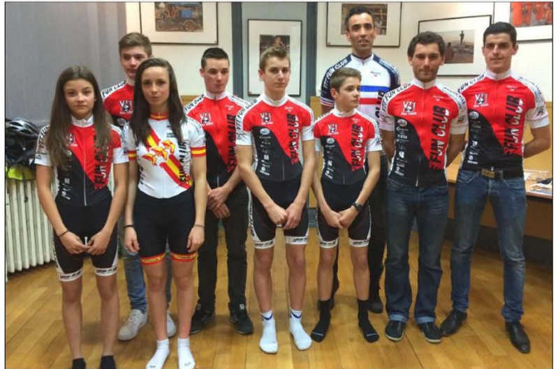
■ Une équipe prête à défendre chèrement les couleurs du club.